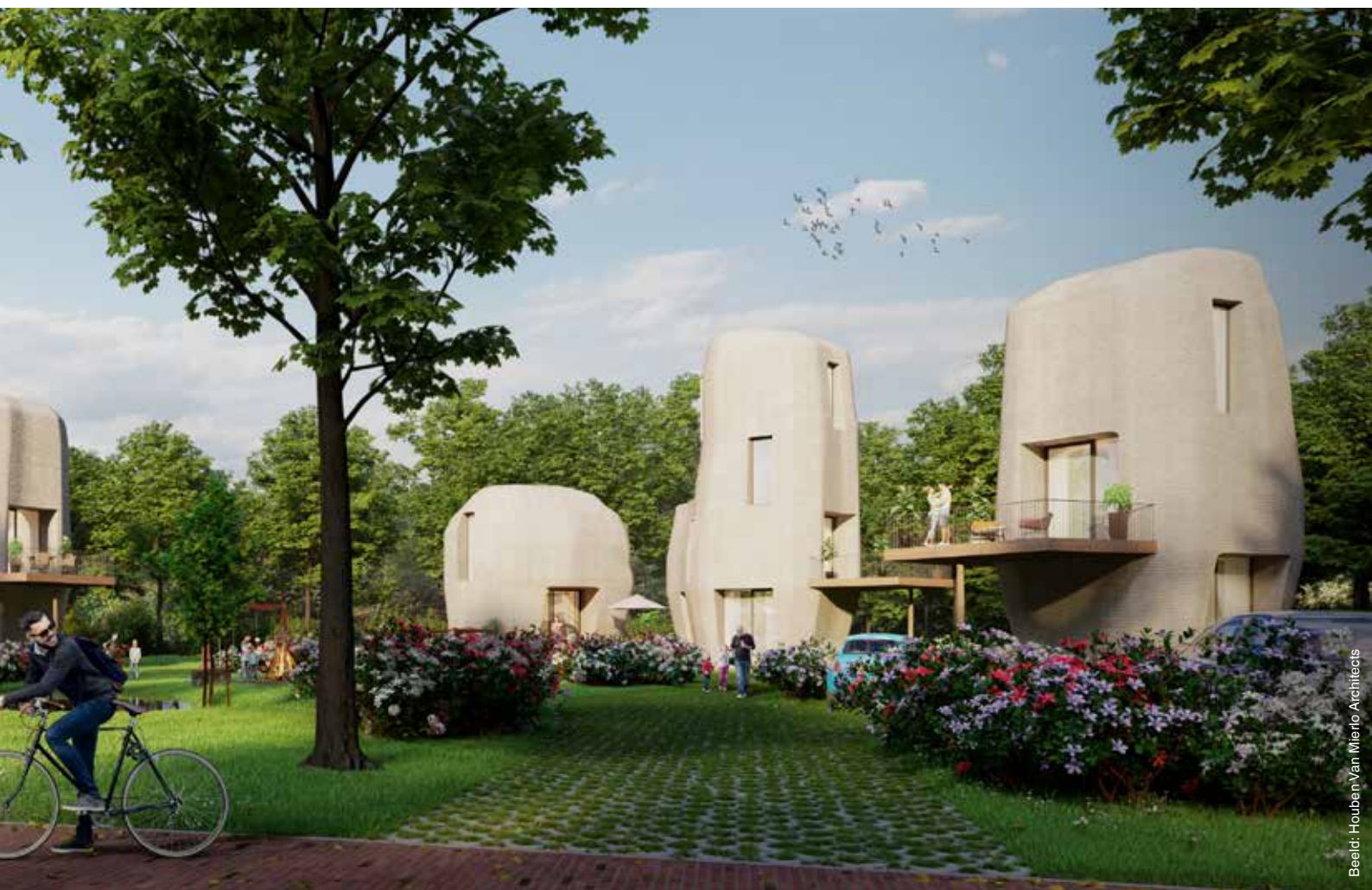
Beeld: Houben Van Mierlo Architects